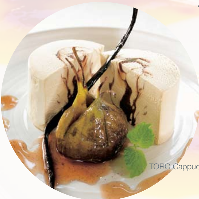
TORO Cappuccinofromasj porsjon