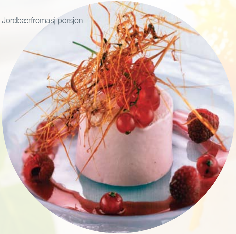
TORO Jordbærfromasj porsjon

TORO porsjonsfromasj kan serveres i store og små selskap, som tallerkenrett eller på buffet. Fromasjene er laget av de beste råvarer og smaker fortreffelig! Tas rett fra frysen og serveres med eller uten tilbehør – enklere kan det ikke bli!