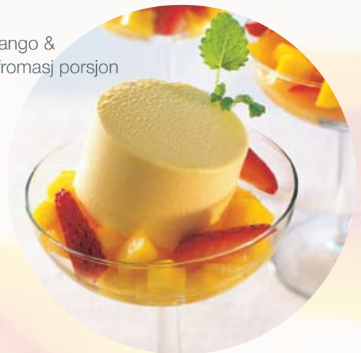
TORO Mango & Appelsinfromasj porsjon